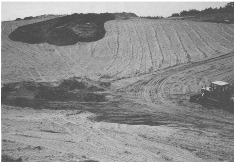
Foto 2: Punta Concón. Remoción de dunas para urbanización. Picture 2. Punta Concón. Dunes removal for urbanization.