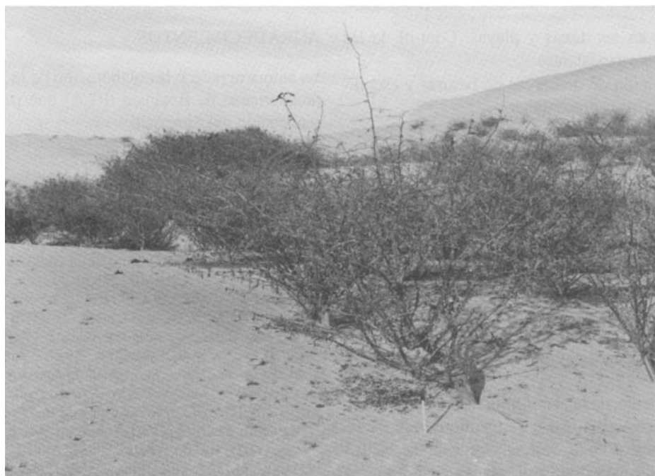
Foto 3: Ritoque. Estabilización de dunas con Lupinus arboreus Picture 3. Ritoque: Dune stabilization with Lupinus arboreus .