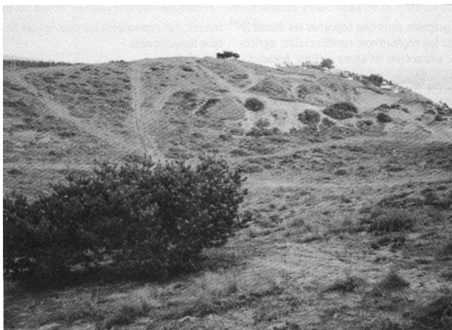
Foto 1: Punta Concón. Destrucción de la cubierta vegetal fijadora por tránsito de vehículos todo terreno.

Picture 1. Punta Concón. Destruction of vegetable covering by vehicles.